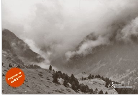
Gestaltung für Kultur- und Gesellschaftskritische Veranstaltungen in Stuttgart