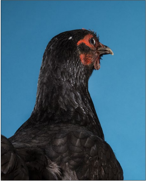
Bildproduktion für Michael Dreyer, Installation angst 1 . Ausstellung „Das Neue“, Kunstverein für die Rheinlande und Westfalen, Düsseldorf, 2016.