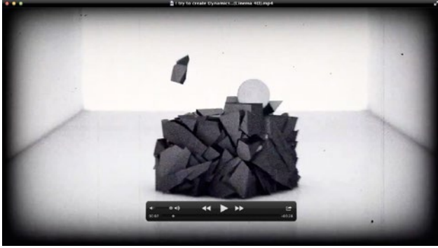
KURZANIMATION Software: Cinema4D und Postproduction in Adobe Premiere und After Effects